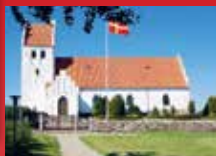
Sandholts Lyndelse Kirke