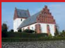
Vester Hæsinge Kirke