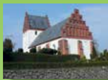
Vester Hæsinge Kirke