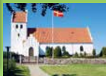
Sandholts Lyndelse Kirke