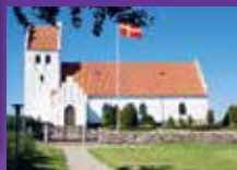
Sandholts Lyndelse Kirke