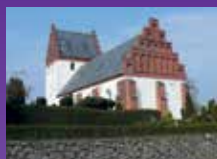
Vester Hæsinge Kirke