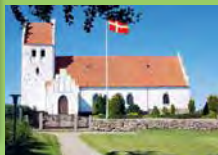
Sandholts Lyndelse Kirke