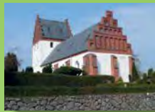
Vester Hæsinge Kirke