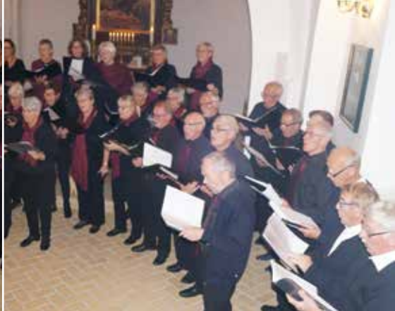
Fælles korkoncert. To kor - én koncert, Vester Hæsing/Sh. Lyndelses lokale kor og Ryslinge Sangkor