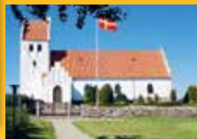
Sandholts Lyndelse Kirke