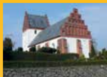
Vester Hæsinge Kirke