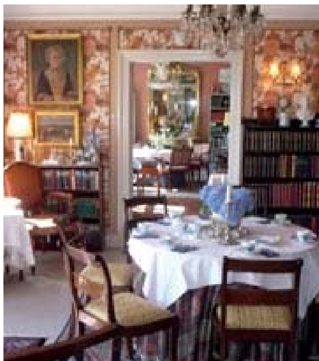
Interiør fra Humlemagasinet

Kommende pastoratsrådsmøder Vester Hæsinge præstegård kl. 19.00, den 26. juni og den 8. august