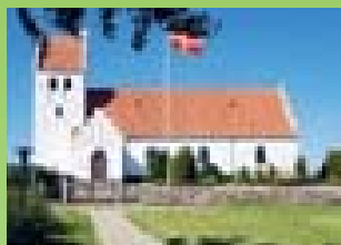
Sandholts Lyndelse kirke