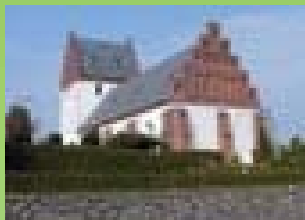
Vester Hæsinge kirke