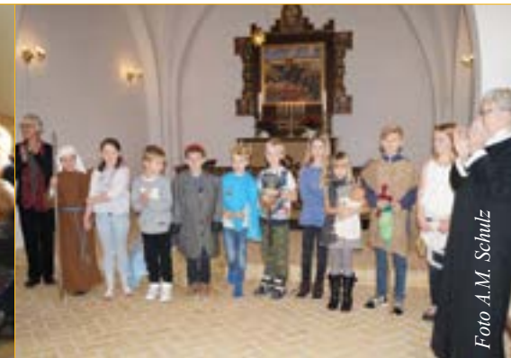
Krybbespil med juniorkonfirmanderne