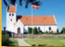
Sandholts Lyndelse Kirke