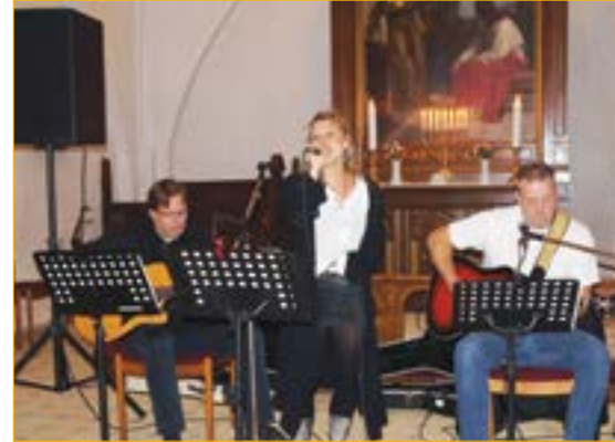
Tro og Toner, "No Boundary"