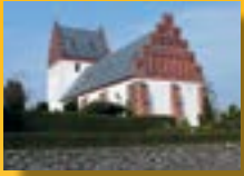
Vester Hæsinge Kirke