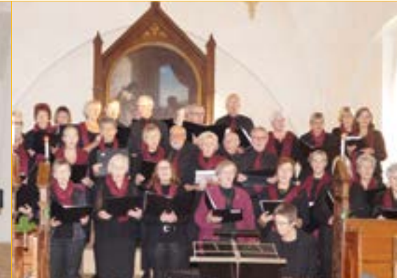
Adventskoncert med Ryslinge Sangkor